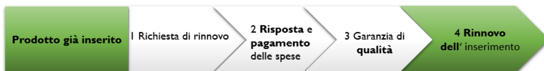
Figura 2: Tappe principali per il rinnovo.

Il grafico 2 visualizza le principali tappe amministrative da proseguire per il rinnovo di un prodotto già incluso nell'Italian Input List.