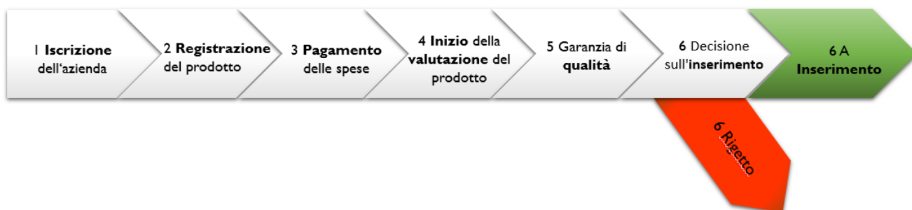
Figura 1: Fasi amministrative principali specificati nella tabella del capitolo 4.

Il grafico 1 visualizza le fasi amministrative principali coinvolte nel processo di valutazione di un prodotto.